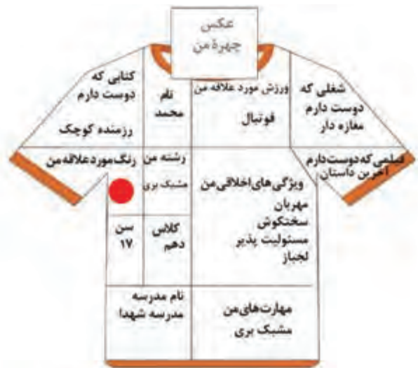
نمونه پیراهن خودشناسی

در ادامه، متن نکته را بخوانید و توضیحات لازم را ارائه کنید. در این بخش با ذکر مثال‌هایی، اهمیت خودشناسی در برقراری ارتباط را به دانش‌آموزان توضیح دهید.