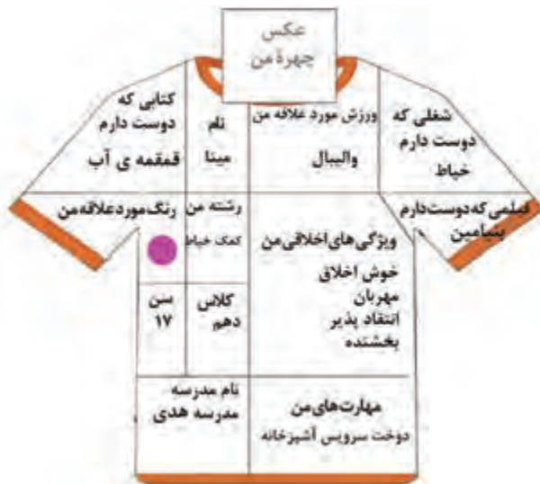
نمونه پیراهن خودشناسی

پیشنهاد می‌شود در هنگام مقایسه ویژگی‌های مختلف دانش‌آموزان با یکدیگر، تأکید بر ویژگی‌های مثبت دانش‌آموزان و مقایسه این ویژگی‌ها با یکدیگر باشد.